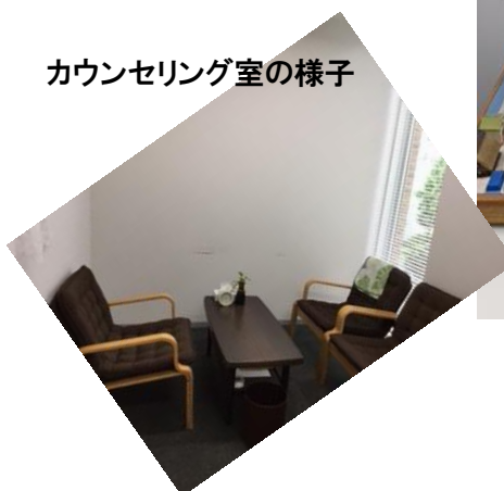
カウンセリング室の様子